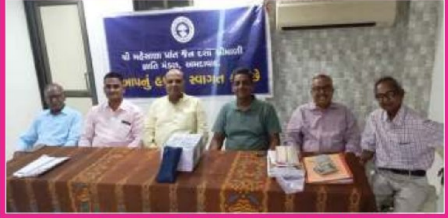
તા.૨૪-૦૫-૨૦૨૬, રવિવારના રોજ શૈક્ષણિક પ્રોત્સાહન યોજના અંતર્ગત ચોપડા વિતરણ કાર્યક્રમ