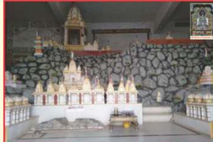
ઉનાવા દેરાસરના પરિસરમાં આવેલ શ્રી શંભુજય તીર્થની રચના