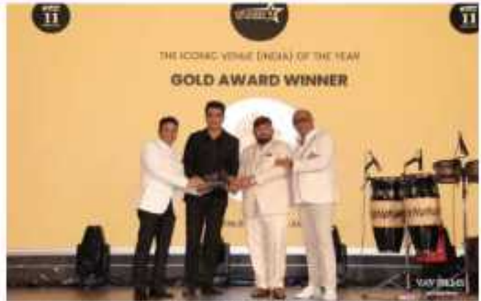
EMF ACE GLOBAL GALA AWARDS