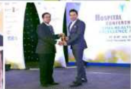
EMF ACE GLOBAL GALA AWARDS