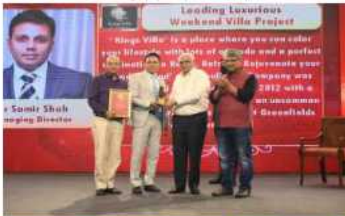
EMF ACE GLOBAL GALA AWARDS