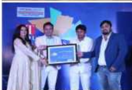
EMF ACE GLOBAL GALA AWARDS