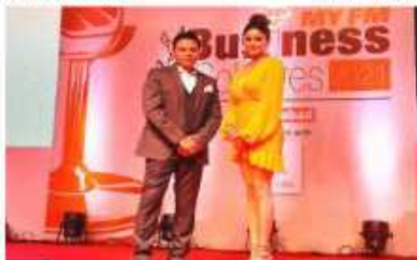
EMF ACE GLOBAL GALA AWARDS