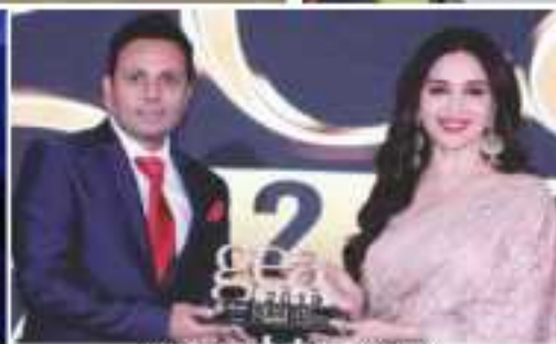
EMF ACE GLOBAL GALA AWARDS