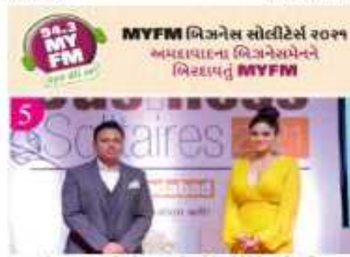
EMF ACE GLOBAL GALA AWARDS