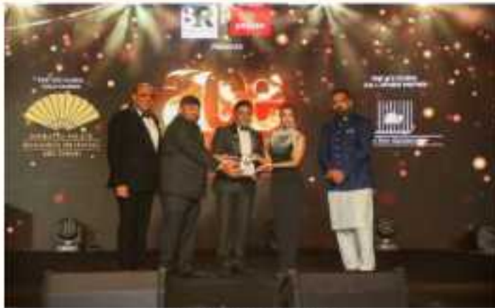
EMF ACE GLOBAL GALA AWARDS