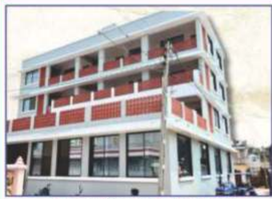
નૂતન ધર્મશાળા અને ભોજન શાળા

ગાંભુ તીર્થે સંપ્રતિકાલીન મૂળના યજ્ઞ શ્રી ગાંભીરા પાર્શ્વનાથની અદ્ભૂત પ્રતિમાજી બિરાજમાન છે. તેમજ પહેલામાળે શ્રી ભીડભંજન પાર્શ્વનાથજીની પ્રતિમા બિરાજમાન છે. શ્રી ગાંભીરાજી પાર્શ્વનાથ પ્રભુના ચમત્કારોની અનેક વાતો લોકમુખે પ્રચલિત છે. ભૂતકાળમાં પ્રભુજીની હથેળીમાં દરરોજ ચાંદીનો સિક્કો મળતો હતો. અત્યારે પણ અવાર-નવાર સુવાસ, ઘંટનાદ, અમીઠાંટણા જેવા પ્રસંગો બને છે.