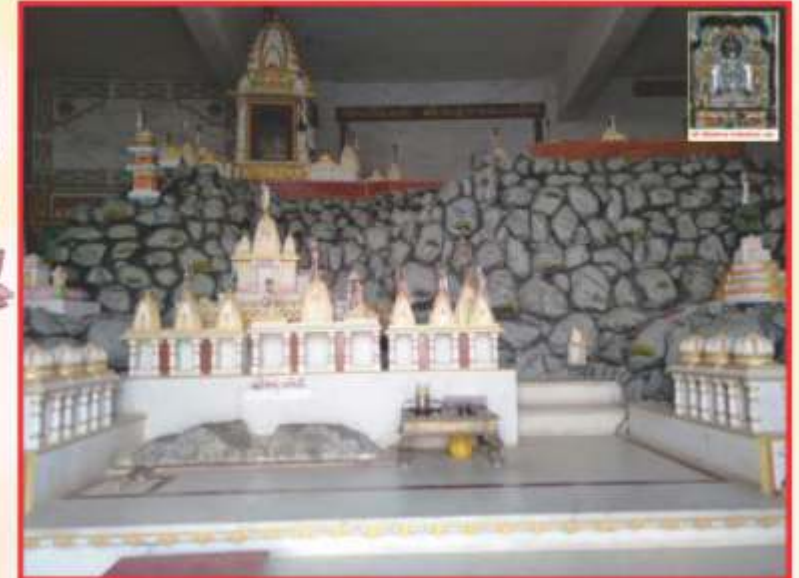
ઉનાવા દેરાસરના પરિસરમાં આવેલ શ્રી શેત્રુંજય તીર્થની રચના