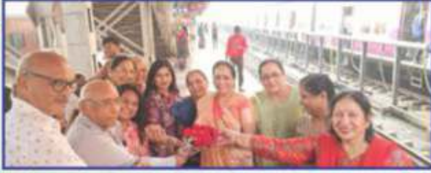
શ્રી અંતરીક્ષણ યાત્રા માટે પૂના સ્ટેશનથી રવાના થતાં મહિલા મંડળને સુખદ યાત્રા માટેની શુભેચ્છા પાઠવતાં મંડળના ભાઈઓ