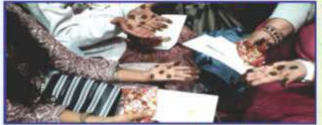
યાત્રાળુને મોટી રકમનું સંઘપૂજન તથા સુકલવંતી મહેદીનો ડોળનું વિતરણ