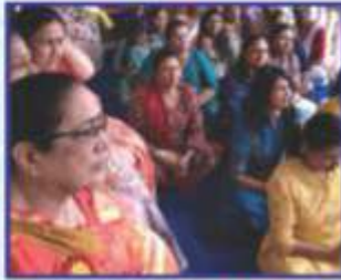
પૂજા તથા જમણ બાદ બપોરની બહેનોની મિટિંગ