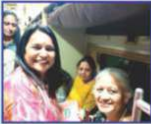
ટ્રેનમાં દરેક યાત્રાળુનું બહુમાન