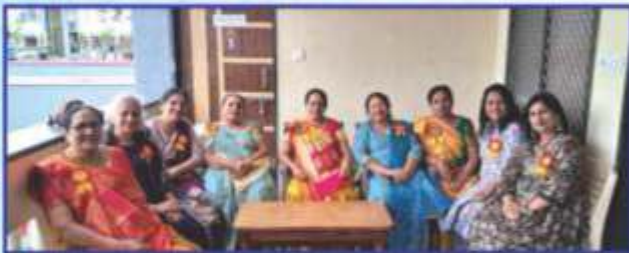
મિટિંગ બાદ આનંદ અને સંતોષનો અનુભવ કરતા કમિટી મેમ્બર્સ