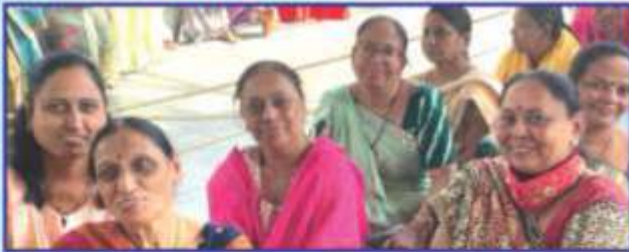
અંતરીક્ષણ દાદાની પૂજા માટે લાઈલમાં બેઠેલી જ્ઞાતિની બહેનો