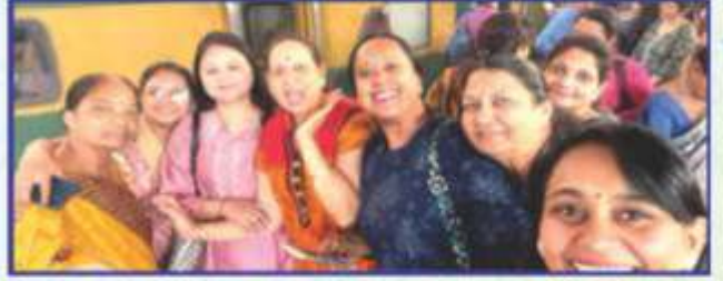
યાત્રા પ્રવાસમાં જોડાવાનાં ઉત્સાહ અને ઇર્મંગ સાથે પુણ્યપુસ્કાલ જ્ઞાતિની બહેનો