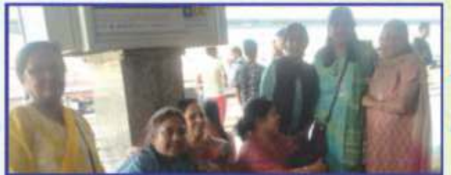
પૂના ગરીબ રથ ટ્રેન આગમનની રાત જોતાં યાત્રાળુઓ