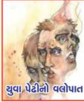
યુવા પેઢીની વલોપાત