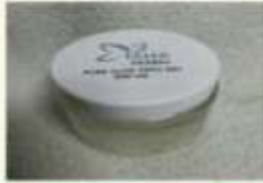
Pure Aloe vera Gel