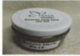
Banana Hair Mask