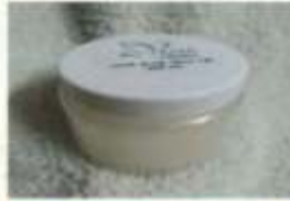
Hair Aloe vera Gel