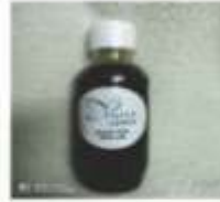
Herbal Hair Oil