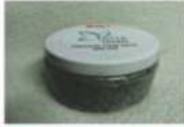
Protein Hair Mask