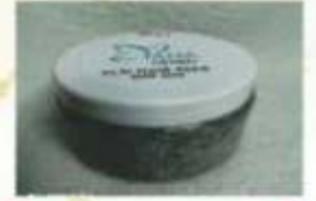
Aaji Hair Mask