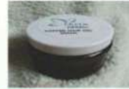
Coffee Aloe vera Hair Gel