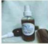
Anti Hair Fall Spray

Hair growth & hair thickening for thin hair | Severe hairfall control Repair of dry & damaged hair | Super shine & bouncy hair Frizz control without losing bounce | Repair of color or chemically treated hair