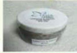
Onion & Hibiscus Hair Mask